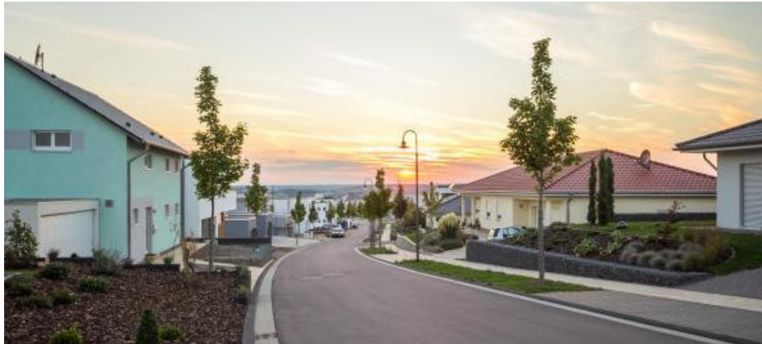
Das idyllisch gelegene Wohnviertel „Auf Mont“ wurde im schicken ländlichen Stil mit großzügigen Baumalleen angelegt, die sich durch das ganze Gebiet erstrecken.

Über 30 Nationalitäten, davon über 300 Luxemburger, haben „Auf Mont“ zu ihrer Wahlheimat ernannt und genießen dort eine ganz neue Art des Zusammenwohnens. Das idyllisch gelegene Wohnviertel wurde im schicken ländlichen Stil mit großzügigen Baumalleen angelegt, die sich durch das ganze Gebiet erstrecken. Über 600 Bäume wurden bis jetzt angepflanzt um das internationale Viertel mit seinen sämtlichen Grünflächen noch gemütlicher und naturfreundlicher zu gestalten. Zwischen 600 bis 1200 Quadratmeter große Grundstücke ste-