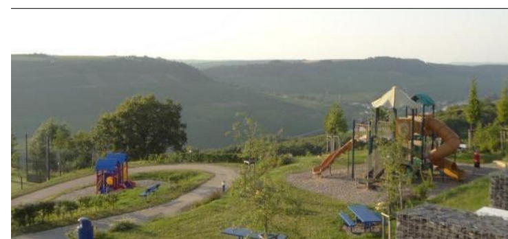
Sämtliche Infrastrukturen stehen den Anwohner direkt vor der Haustür zur Verfügung, wie zum Beispiel Sport- und Spielplätze.