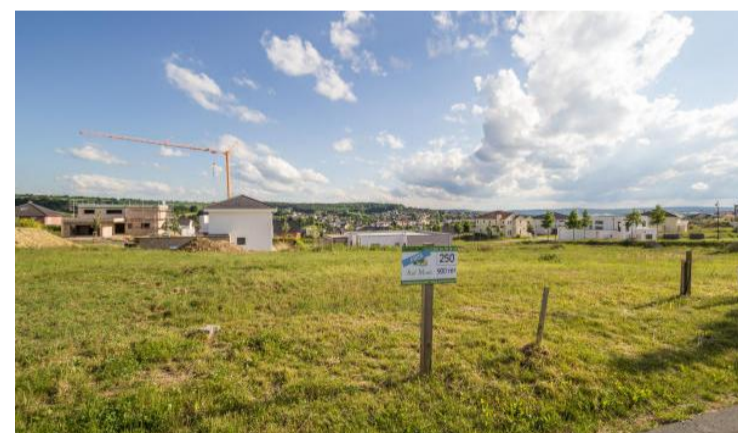
Von den insgesamt 320 Grundstücken, stehen nur noch 50 freie Bauplätze derzeit zum Verkauf.