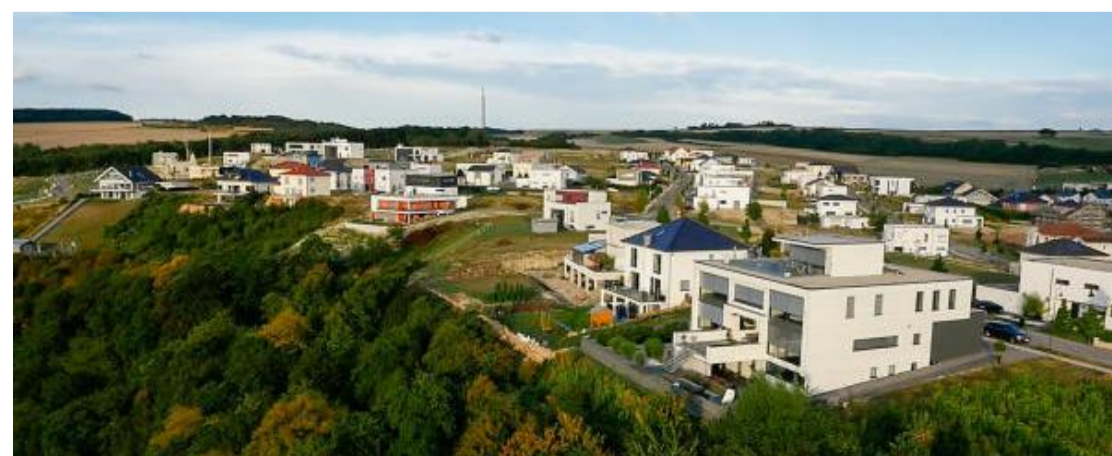
Zwischen 600 bis 1200 Quadratmeter große Grundstücke stehen den Bauherren zu Verfügung, die ihr neues Zuhause ganz individuell gestalten können.